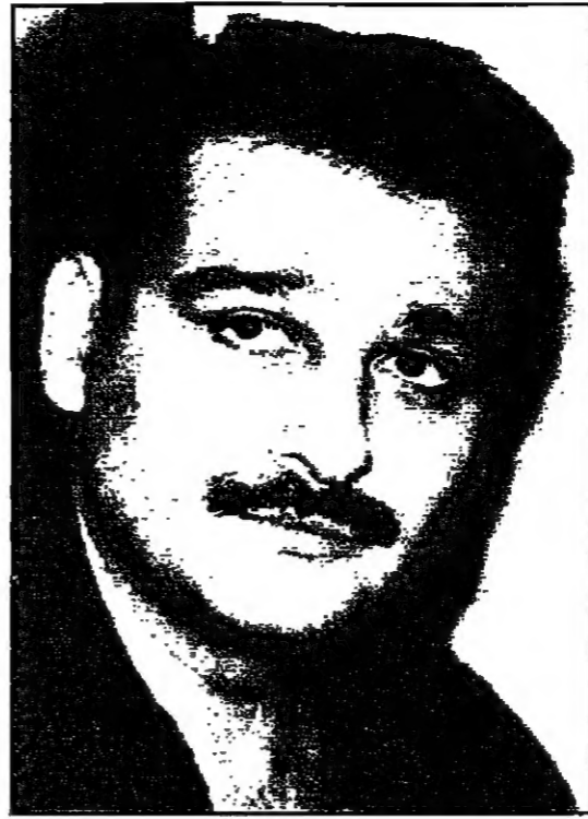
جمال سليمان، وإلى اليسار في لقطة من التريple

الفنان جمال سليمان وجه دائم الحضور على الشاشة الصغيرة، قدم العديد من الأعمال التي حوت على الكثير من الإبداع، فقد اجاد في الدراما الاجتماعية، والسياسية، كما اجاد في الكوميديا. ولعل مثابرة الفنانة الصاعدة السورية، يلهم ذلك الفنانين الأوائل في الوطن العربي.